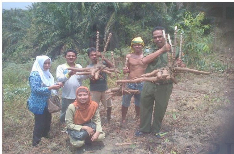
Gambar 4.2 Dokumentasi Ekonomi Masyarakat Kelurahan Minas Jaya

Sektor perdagangan hasil hasil industri rumah tangga merupakan salah satu komoditas yang cukup diminati serta menjanjikan karena secara geografis hampir secara keseluruhan wilayah kelurahan ini dilalui jalan lintas antar provinsi,pada level inilah yang merupakan aspek penunjang pendapatan keluarga yang bermuara pada pencapaian tingkat pendapatan perkapita serta mewujudkan peningkatan pendapatan asli Kelurahan (PAKes) 53