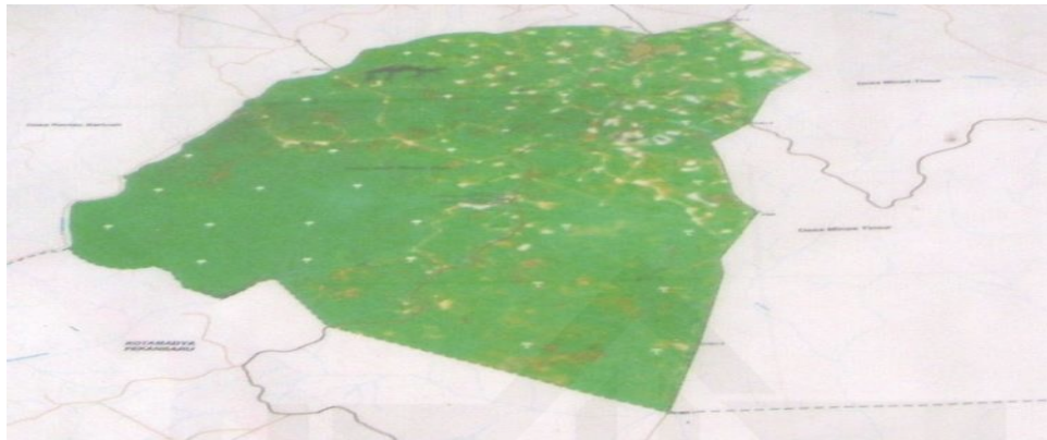
Gambar 4.1 Peta Wilayah Kelurahan Minas Jaya