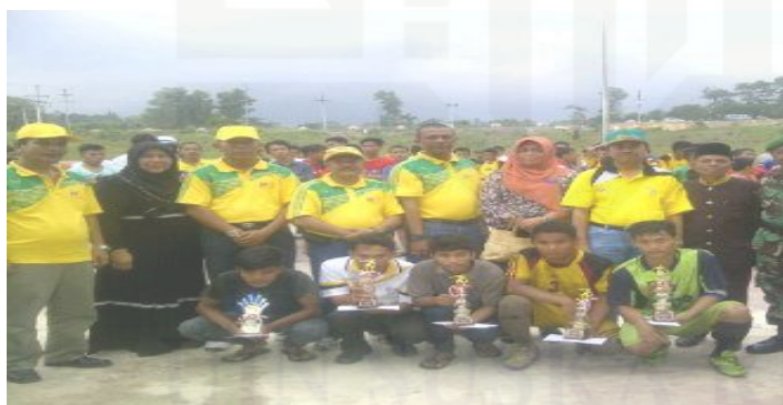
Gambar 4.3 Dokumentasi Peranan Wanita Kelurahan Minas Jaya