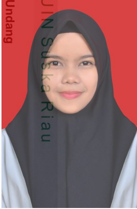
Hak Cipta Diindungi Undang-Undang