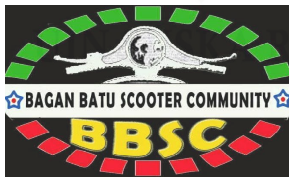
Gambar 4. 2 : Lambang Komunitas BBSC

Bagan Batu Scooter Community memiliki lambang yang berupa gambar oval, dikelilingi rantai dua warna hijau dan merah dengan latar belakang warna dasar hitam. Berikut lambang komunitas BBSC 69 :