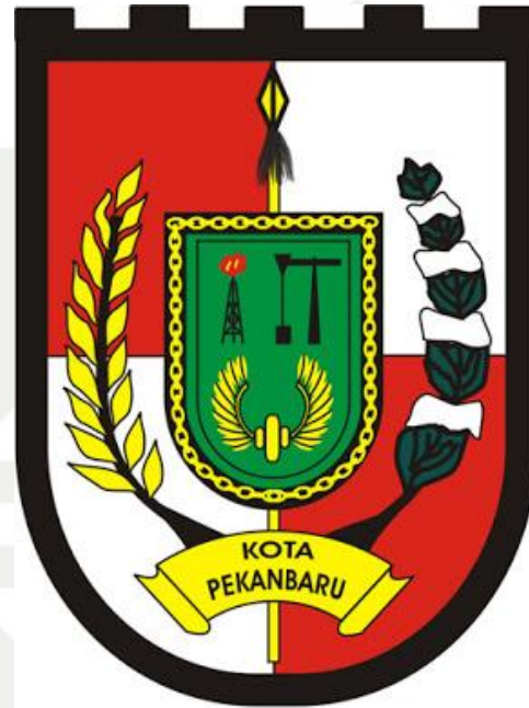
GAMBAR 4.1 LOGO KOTA PEKANBARU