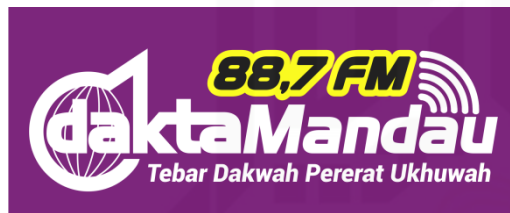
Gambar 4.1 Logo Radio

E. Pendengar Radio : 60% wanita dan 40% pria Berusia 17 - 65 tahun Golongan (Social & Economic Status) B, C, D, E