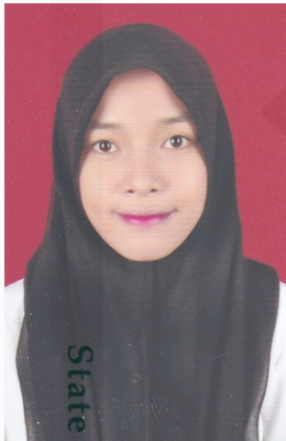
State Islamic University of Sultan Syarif Kasim Riau