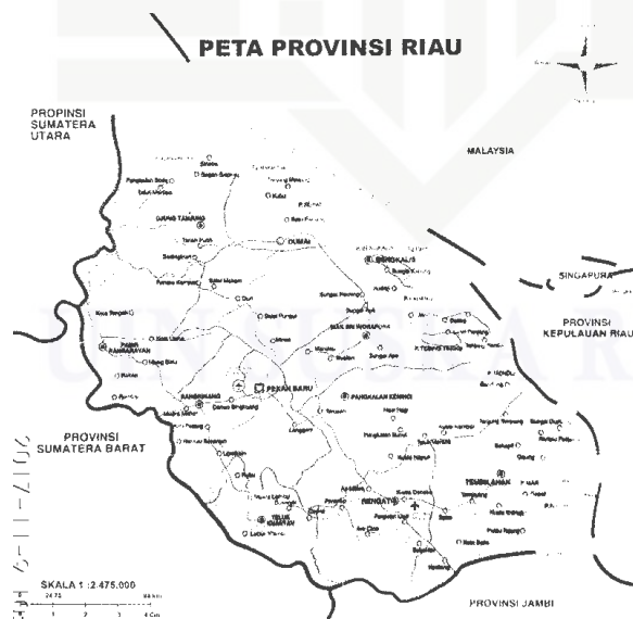
Gambar 4. 1 Peta Wilayah Provinsi Riau

2. Dilarang mengumumkan dan memperbanyak sebagian atau seluruh karya tulis ini dalam bentuk apapun tanpa izin UIN Suska Riau.