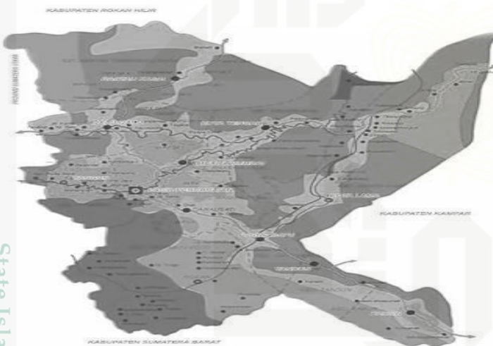
Gambar 4. 3 Peta Wilayah Kabupaten Rokan Hulu