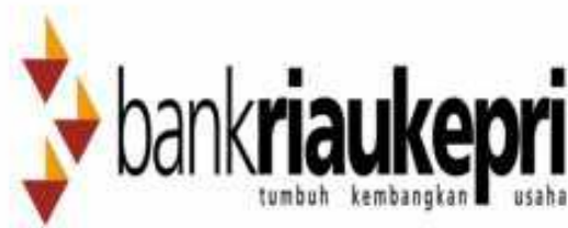
GAMBAR II.1 Logo Bank Riau Kepri